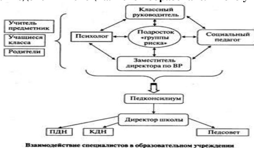
Схема взаимодействия специалистов образовательного учреждения.